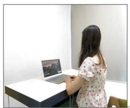
图3：侧后方第二机位效果图