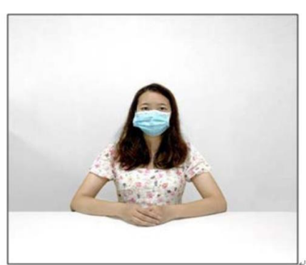
图2：正前方第一机位效果图